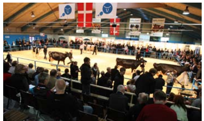
Malkeracerne har haft dyrskue i hal Q, og dyrene er her blevet fulgt med store interesse både i og uden for ringen.