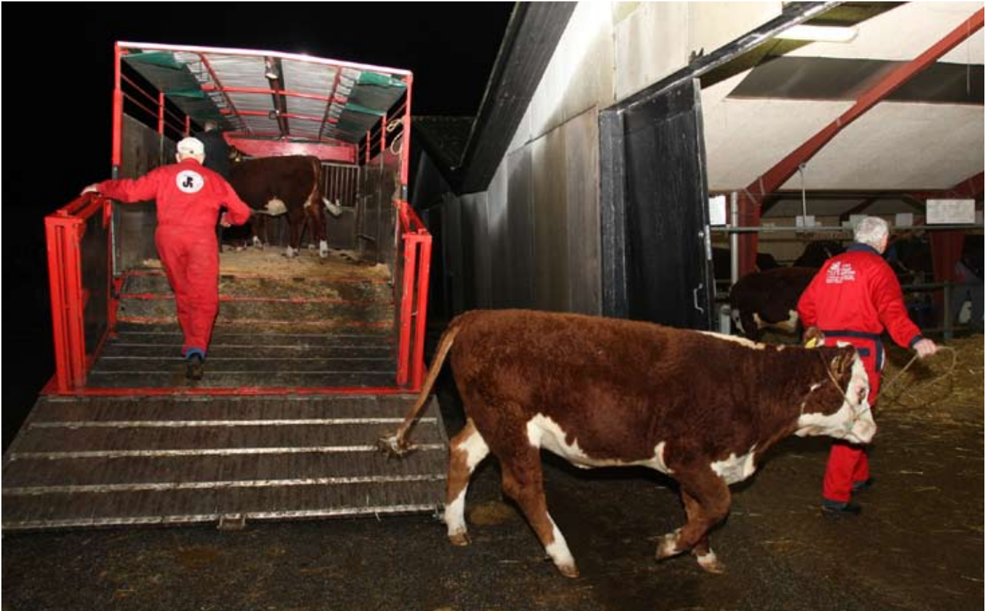
Efter udstillingen lukkede torsdag begyndte lastbilerne at rulle ind med de mange dyr, der i dag og i morgen deltager i kødkvægskuet.