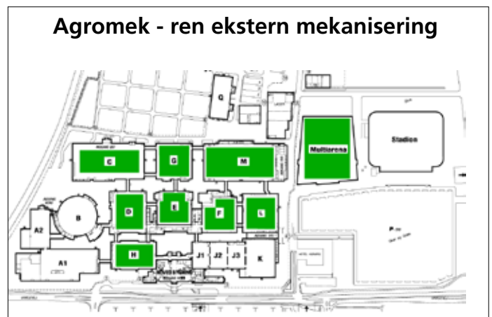
Ved en ren ekstern udstilling vil flere haller være i brug, men spørgsmålet er, om den vil være interessant for udenlandske besøgende.