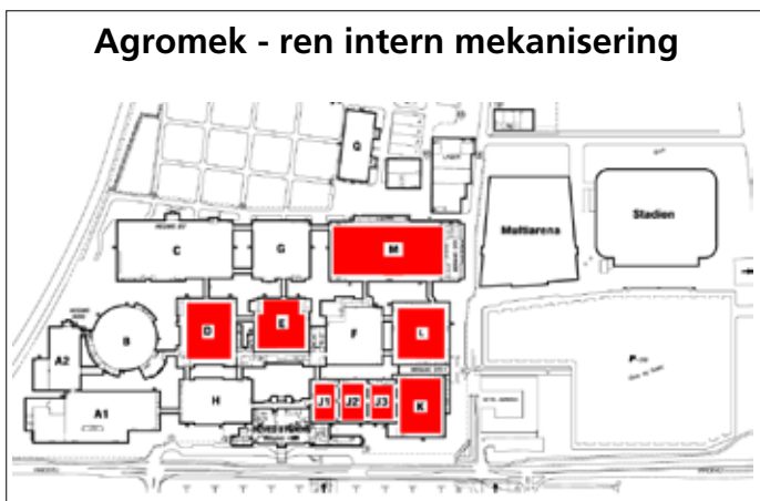
Ved en ren intern udstilling forventes det, at der ville være to haller mindre i brug end i 2009.