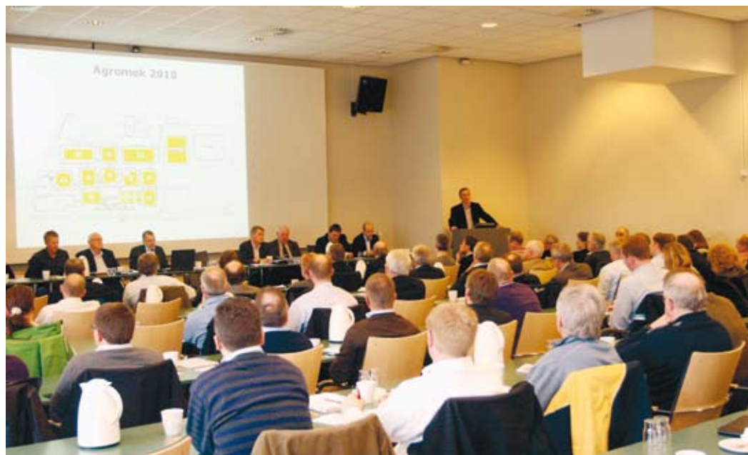
Udstillere samlet til møde i Kolding tirsdag eftermiddag, hvor der blev orienteret om baggrunden for at Agromek fremover holdes hvert andet år.

- Eksporten er altså en vigtig del af vores dagligdag. Derfor mener vi, at det er vigtigt at fastholde Agromek som en international udstilling. Det er ikke det samme som at sige, at vi tror på, at vi kan udkonkurrere udstillingerne