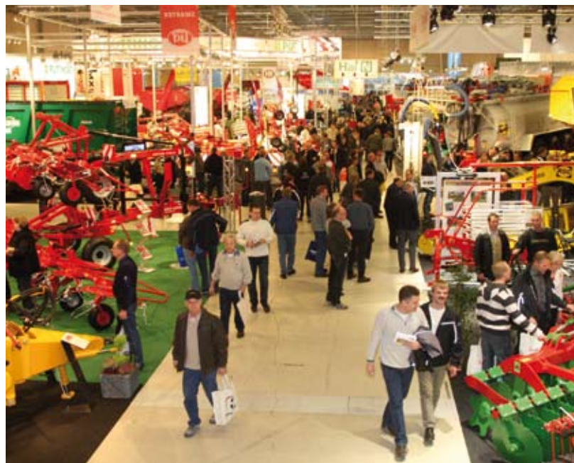
I en samlet bedømmelse var langt hovedparten af udstillerne tilfredse med Agromek november 2008, viser udstillerundersøgelsen.

29 procent synes interessen fra udenlandske købere